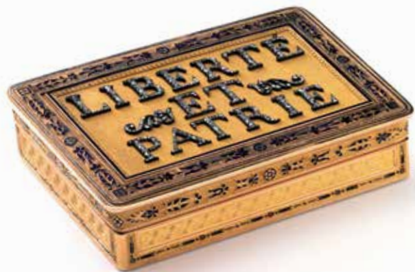
1 Tabatière de Frédéric-César de La Harpe, donnée en remerciement par le canton de Vaud, 1815