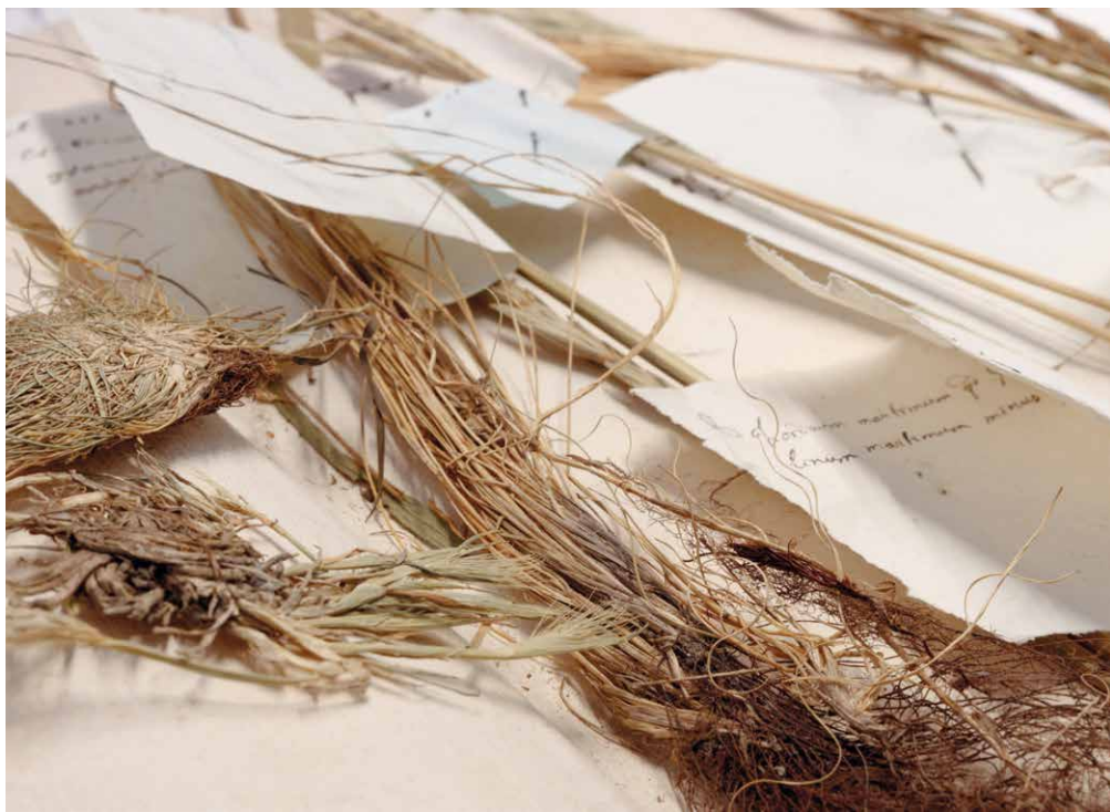
Bibliothèque publique et universitaire de Neuchâtel, Herbier Jean-Jacques Rousseau