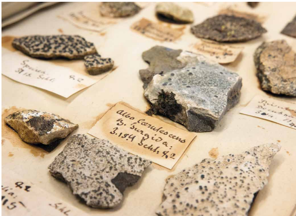
Herbier de l'Université de Neuchâtel